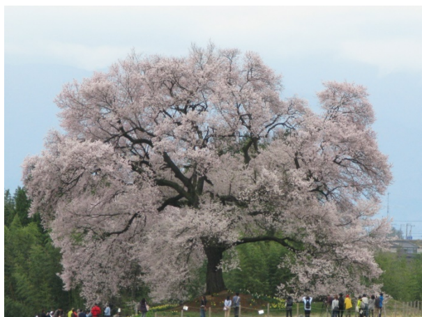
わに塚の桜(元気なころ)

一気に季節が動いて春がやってきました。 covid-19 の感染は新たな変異株も出て収まる気配もないですが、ずっとこのままというわけにもいかず、でも完全に自由になるのも心配で、もどかしいところです。 この2年間すべての人がマスク生活を余儀なくされていますが、産まれた赤ちゃんももうすぐ3才になります。 目に入る大人はみんなマスクをしているし、保育園でも幼稚園でも先生のみしか知らない子供が沢山います。 先日、高校生が卒業アルバムの写真を撮ることになって、順番にマスクを外したらすごく受けたってという笑い話にもならない現実にショックを感じました。